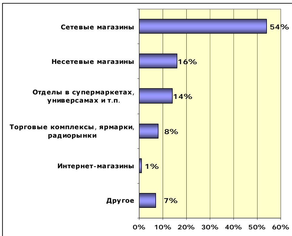
ДИАГРАММА 2. ОСНОВНЫЕ МЕСТА ПОКУПКИ БЫТОВОЙ ТЕХНИКИ И ЭЛЕКТРОНИКИ