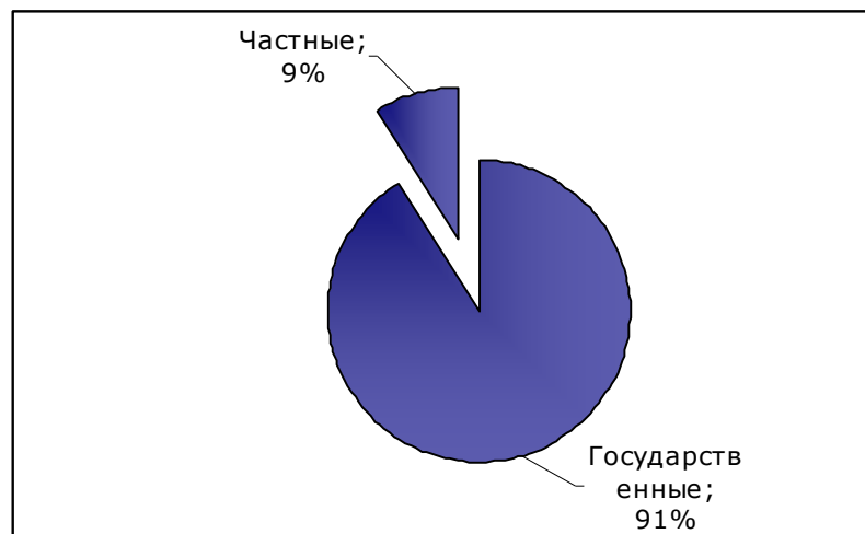
ДИАГРАММА 1. СООТНОШЕНИЕ ГОСУДАРСТВЕННЫХ И ЧАСТНЫХ ДЕТСКИХ САДОВ, %