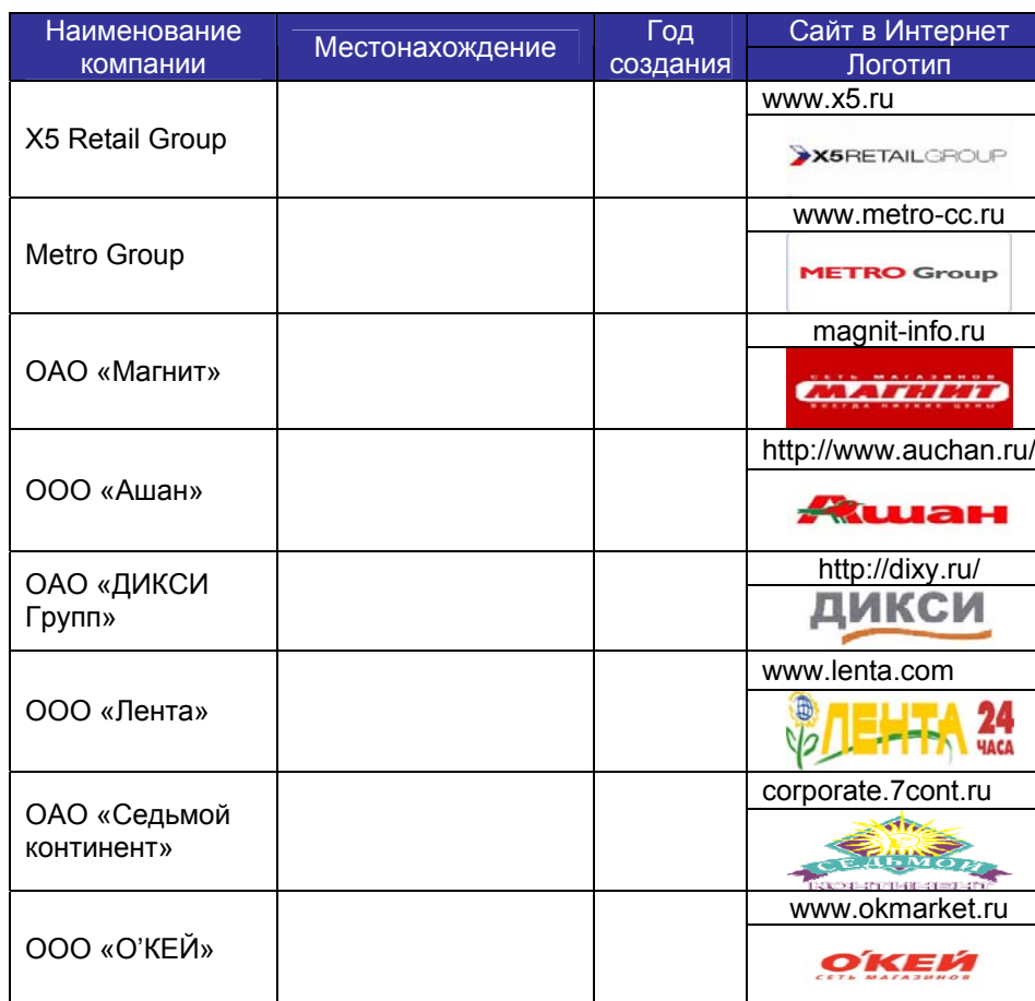
ТАБЛИЦА 16. ОСНОВНЫЕ СВЕДЕНИЯ ОБ ОСНОВНЫХ РОЗНИЧНЫХ КОМПАНИЯХ РОССИЙСКОГО РЫНКА КОЛБАСНЫХ ИЗДЕЛИЙ В 2014 ГОДУ